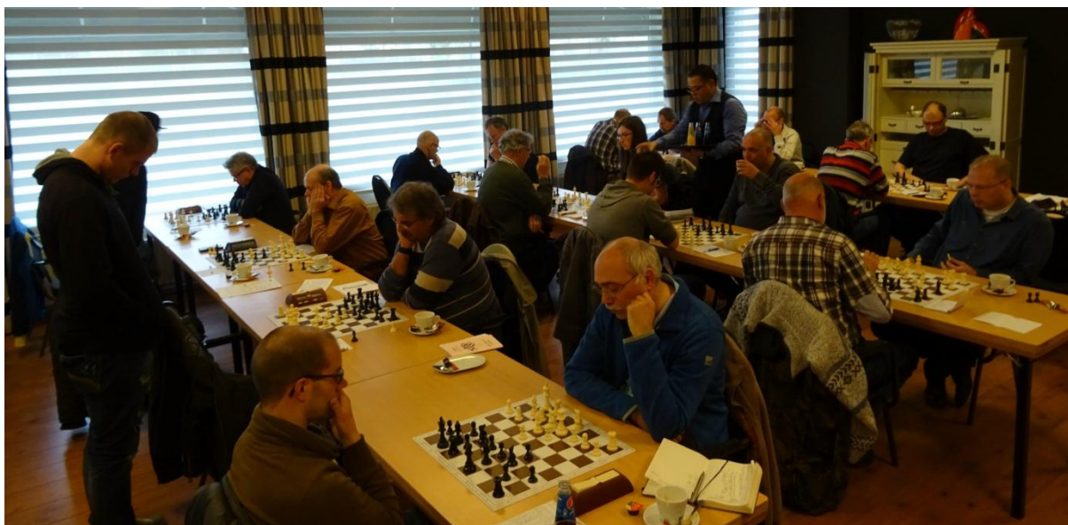
1 Overzichtje